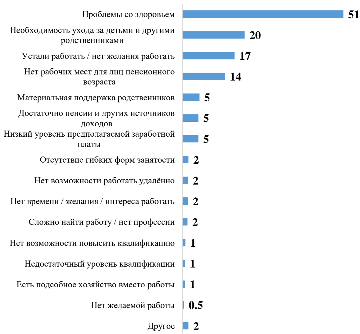
Рисунок 2 – Распределение ответов на вопрос: «Уточните, пожалуйста, главные причины Вашего решения не работать на пенсии?», в % среди не планирующих работать на пенсии респондентов.

Ключевой фактор, препятствующий продлению трудовой деятельности граждан на пенсии – проблемы со здоровьем (51%). Далее следуют: необходимость ухода за детьми и другими родственниками (20%), отсутствие желания/сил работать (17%), отсутствие рабочих мест для лиц пенсионного возраста (14%).