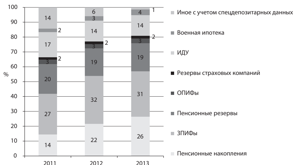
График 1. Структура рынка доверительного управления и коллективных инвестиций в 2011–2013 годах

Лидером, как по абсолютному, так и по относительному росту, в 2013 году стали пенсионные накопления НПФ, нарастив 280 млрд рублей, или 42%. Однако значительный рост продемонстрировали также пенсионные резервы – на 18%, ЗПИФы – 10% и ИДУ – 16%.